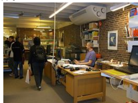
Nord Fyn 高等学校の図書館

「国家百年の計は教育にあり」住みよい幸せな国づくりを目指す私たちのNPOの目的実現のためには全ての日本国民が教育のあり方、真の教育とは何かを今こそ理解しなければならない時であることを問う。